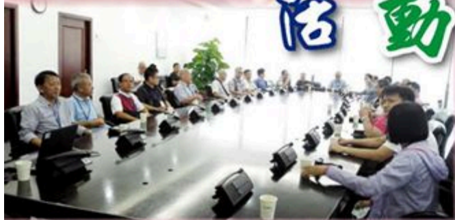
工聯會物流及交通行業委員會與廣州地鐵公司工會交流