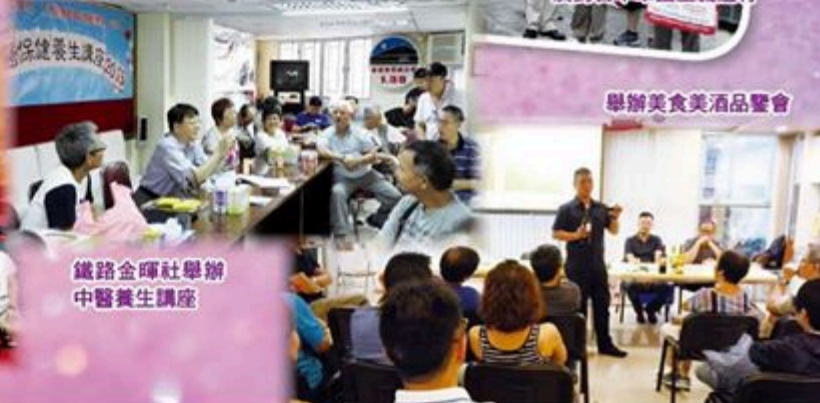
鐵路金輝社舉辦中醫養生講座