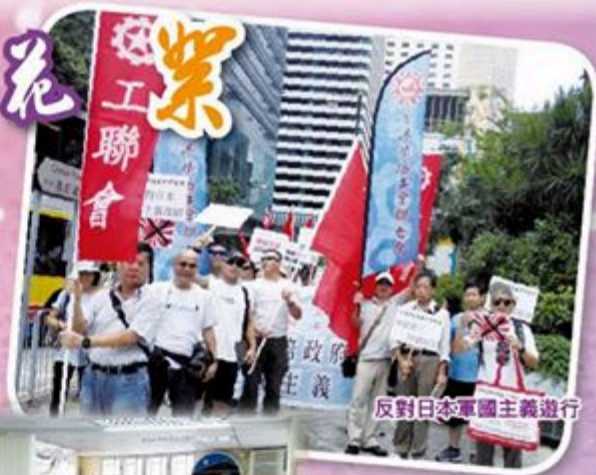
反對日本軍國主義遊行