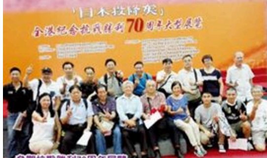
參觀抗戰勝利70周年展覽