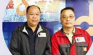
香港鐵路員工總會理事長