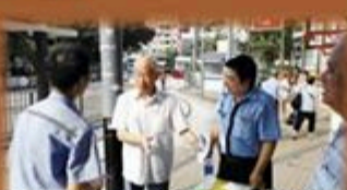
香港電車職工會發起保衛電車路簽名行動

電車自1904年起為港島居民服務了111個寒暑，是本港極具有歷史價值、特色的交通工具。乘坐雙層電車亦是香港人共有的生活體驗。日前某「顧問公司」代表一句「抱殘守缺」企圖「訂走」中區電車服務，激怒全港市民和700名電車職工。香港電車職工會認為：許多司機已經視電車為終身職業，如果該顧問的建議被採納，將會直接影響電車的運營及電車工人的收入及家庭生計。為保衛中區電車路，保障工人就業，電車職工會舉行記者會及發動多名電車車長及家屬身體力行，在4場公開街站號召市民聯署支持「保衛電車路」，6小時街站共計收到逾1700封反對信。