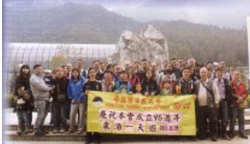
電車工會95周年會慶旅行