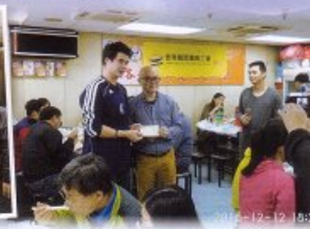
鐵路職員工會蛇賽