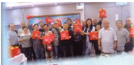
金輝社生日會茶聚