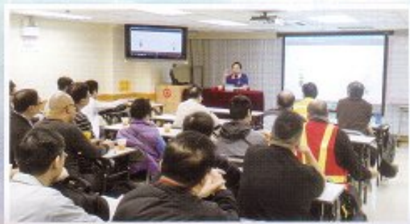
鐵道從業員總工會舉辦建築業工人註冊簡介會