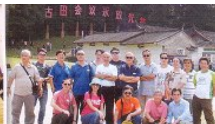
參觀古田會議舊址