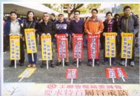
工聯會爭取取消強積金對沖遊行