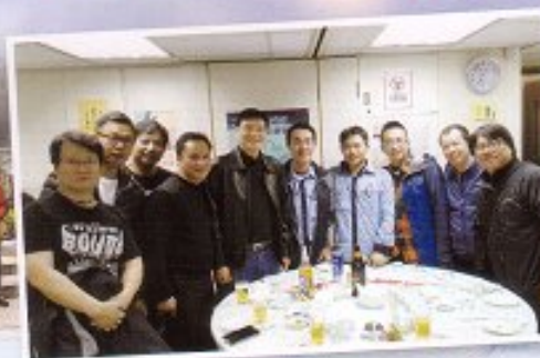
電車職工會理事與王國興議員合影