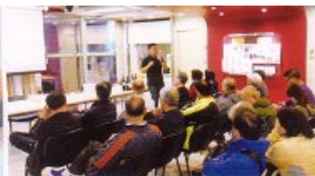
第二期美酒品嚐會