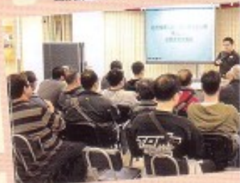
香港鐵道從業員總會會員全接觸兩日