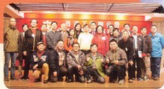
參加工聯會新春聯歡會的義工與會長及理事長合影