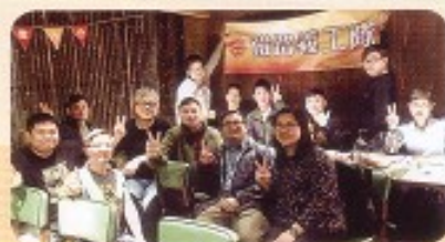
鐵路義工隊新春團拜